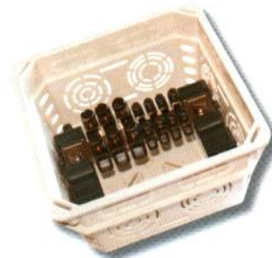
Příklad použití v instalační krabici KO 100 E